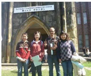
秋季全学入学式に

IPADS 公式ホームページ http://ipads.a.u-tokyo.ac.jp/ (岡田謙介特任教授)