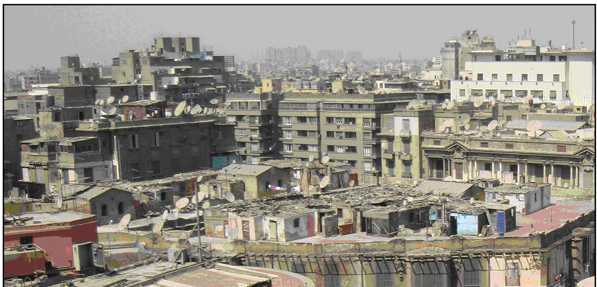
高層ビルのルーフトップ家屋（カイロ、エジプト）