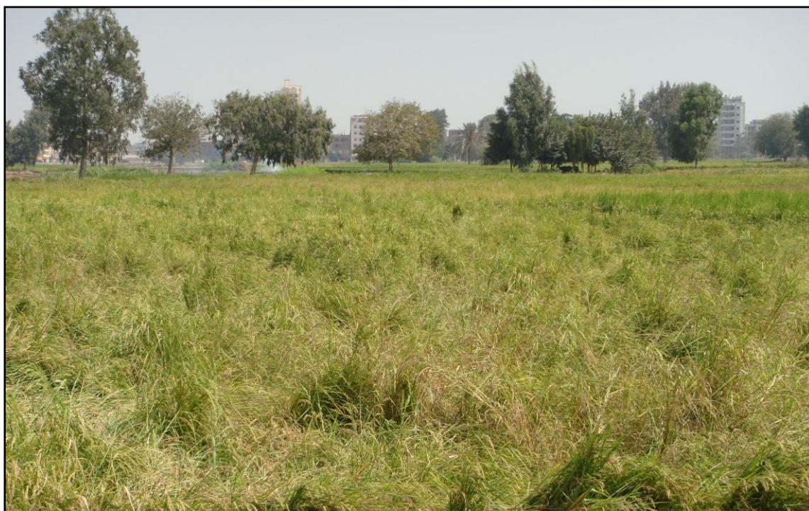
農村の水田 (タンタ付近、エジプト)