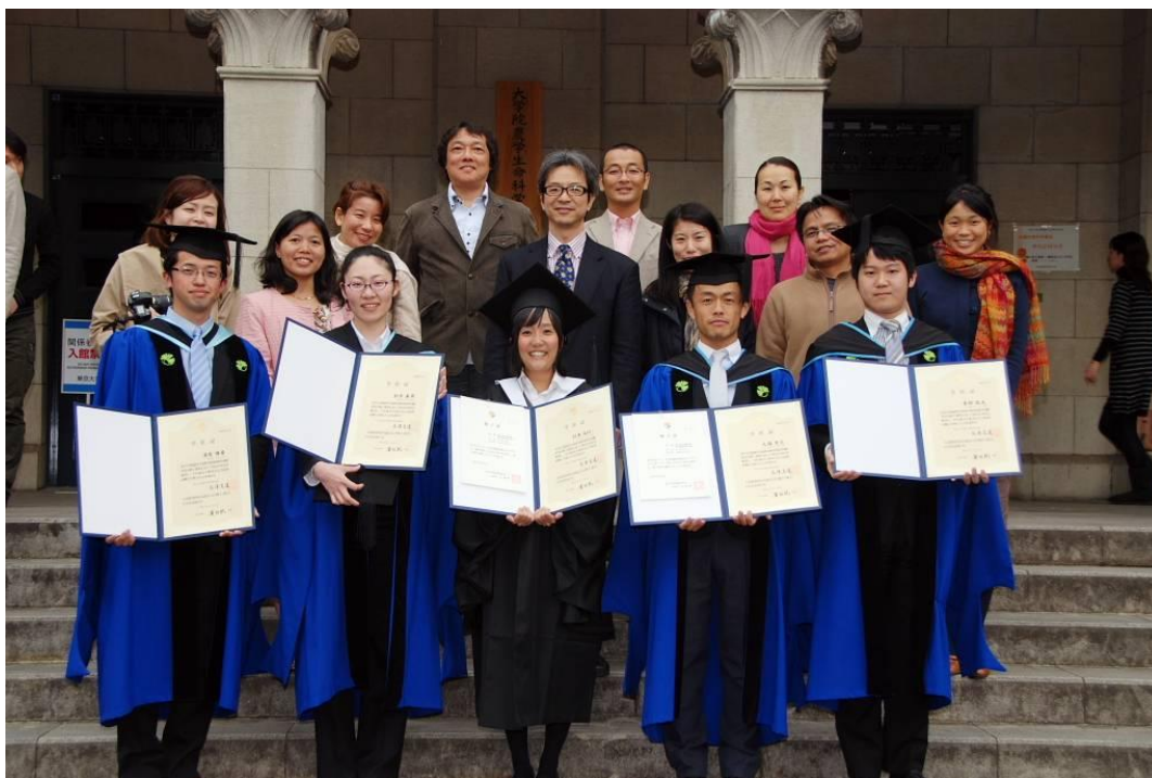
写真 2011年度の修士課程を修了した研究室メンバーと

者に「忘れられた当たり前を探す：目からウロコのフィールドワーク」を執筆してもらっています。この連載では、フィールドでの葛藤や村人たちのシワに刻まれた思い、汗のニオイ、本音がポロリとこぼれ落ちてきたときの何とも言えない笑いの共有、そんなみんなの心に残った景色など、論文にできないデータ、村人の語りから、大事なメッセージを拾い出してもらっています。これからも研究室のみなで、率直な村人の語りの間から立ち上ってくるような、人が生き物として繰り返してきた息吹のような忘れられた当たり前、でもけて論文では表現できない、人の根っこにあるようなものを、伝えられたらと思っています。ウェブ版はこちらから読むことができますのでどうぞ。 http://www.ir3s.u-tokyo.ac.jp/websasutena (文責：田中)